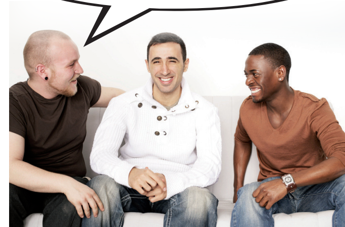
Antek Werbekontor, Gescher